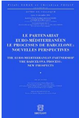
Dir. Filali OSMAN et Christian PHILIP

Tome 4 : Vers une lex mediterranea de l'arbitrage dans les pays de l'Union pour la Méditerranée (Actualité et perspectives : droit(s) des pays membres de l'Union européenne, Union pour la Méditerranée, droit comparé, droit international). (s. la direction de Filali OSMAN et L. CHEDLY), publication aux éditions Bruylant en février 2015.