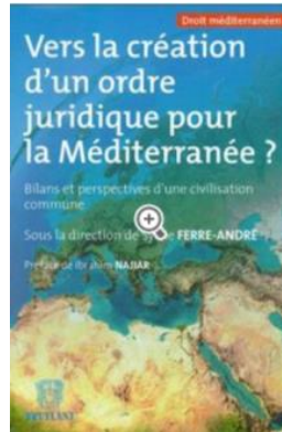
Dir. Sylvie Ferré-André (T.1)